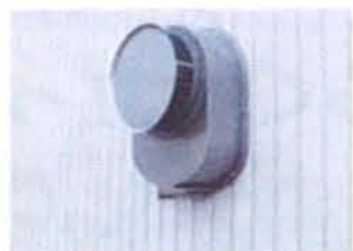
防虫フード(オプション)

換気ユニットでは、フィルターにより花粉や塵、PM2.5等を取り除き、外気を炭の層へ送り込みます。