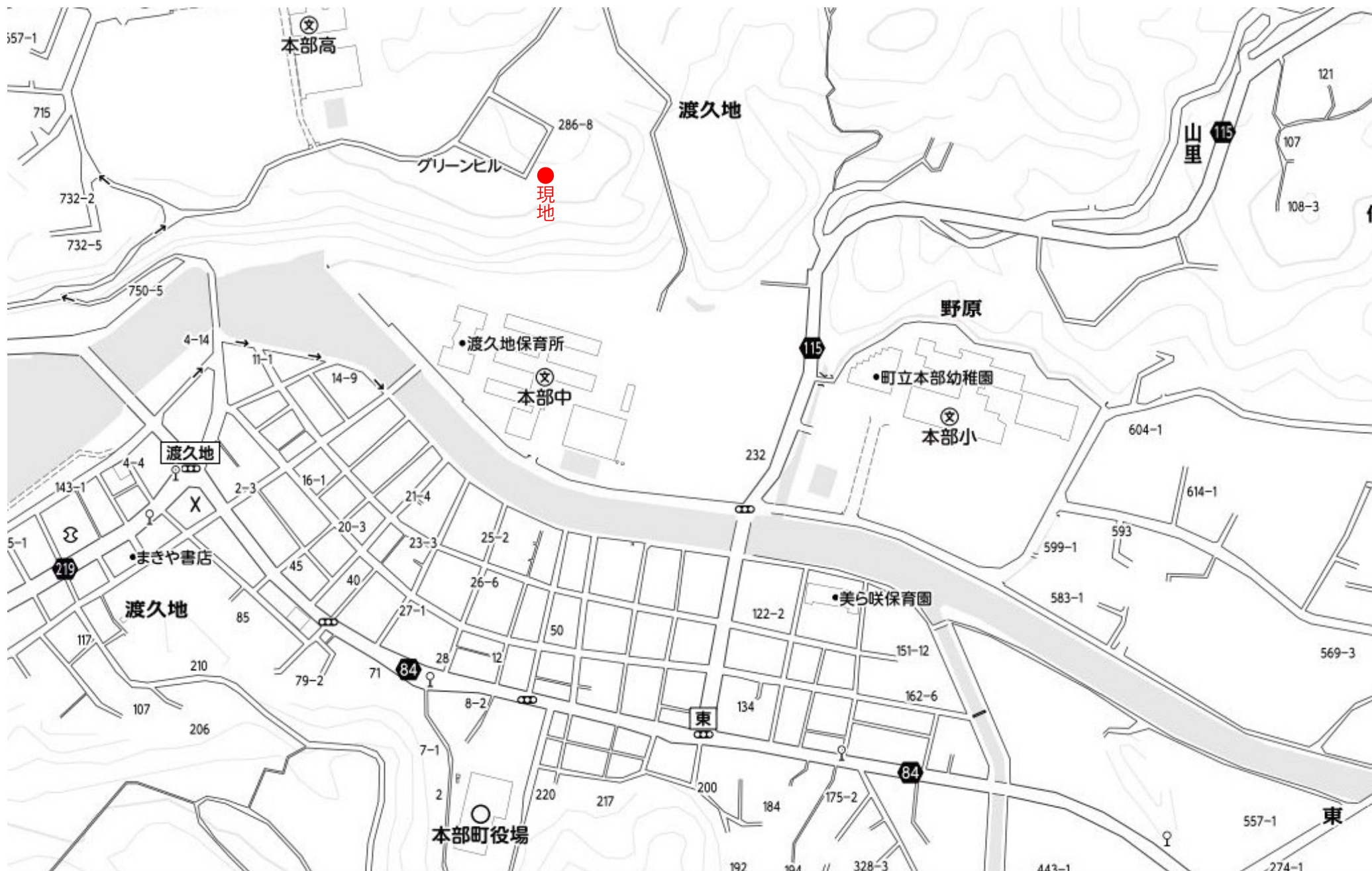
所在地:本部町字渡久地 2 8 6 番地 1 4、15 (カーナビは本部町渡久地 2 8 6 - 6 でセット) 地積426㎡・128.8坪(公簿)