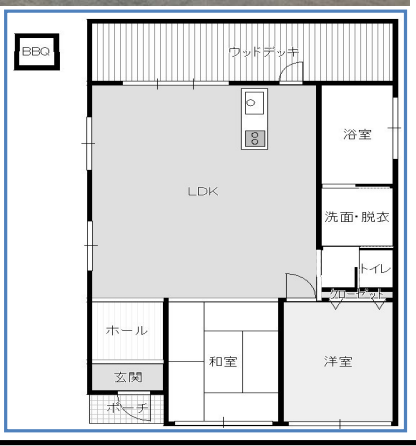
現況と図面が異なる場合、現況優先とさせていただきます。