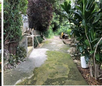
現況と図面が異なる場合、現況優先とさせていただきます。