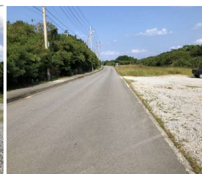
現況と図面が異なる場合、現況優先とさせていただきます。