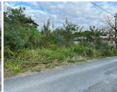
現況と図面が異なる場合、現況優先とさせていただきます。