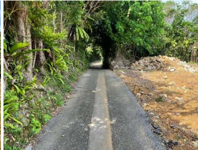
現況と図面が異なる場合、現況優先とさせていただきます。