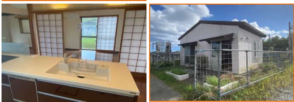
現況と図面が異なる場合、現況優先とさせていただきます。